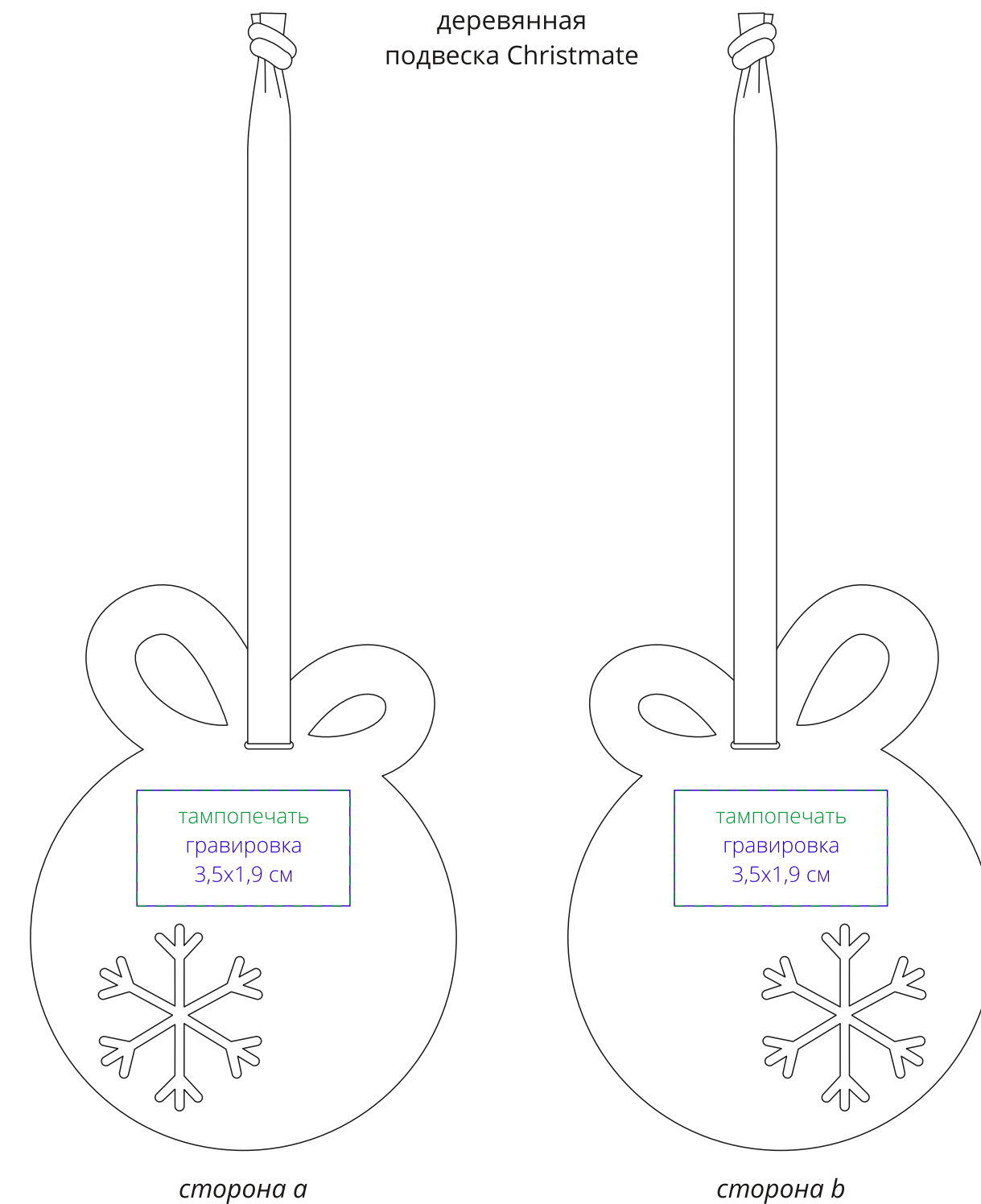
деревянная подвеска Christmate