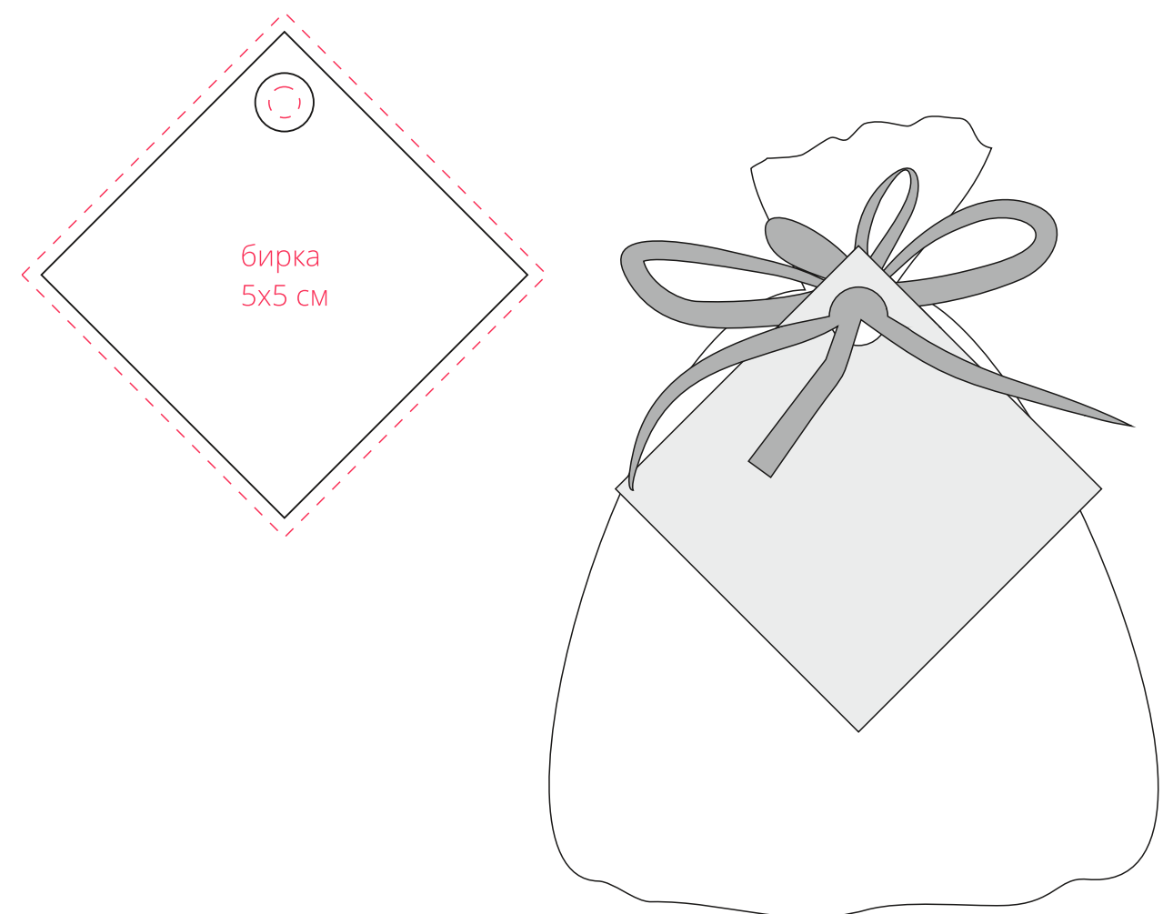
Специи для глинтвейна Winter Joy